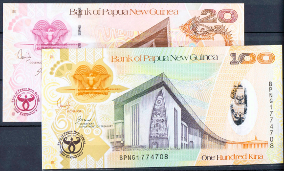
2008 35 Aniv. BANK PAPUA