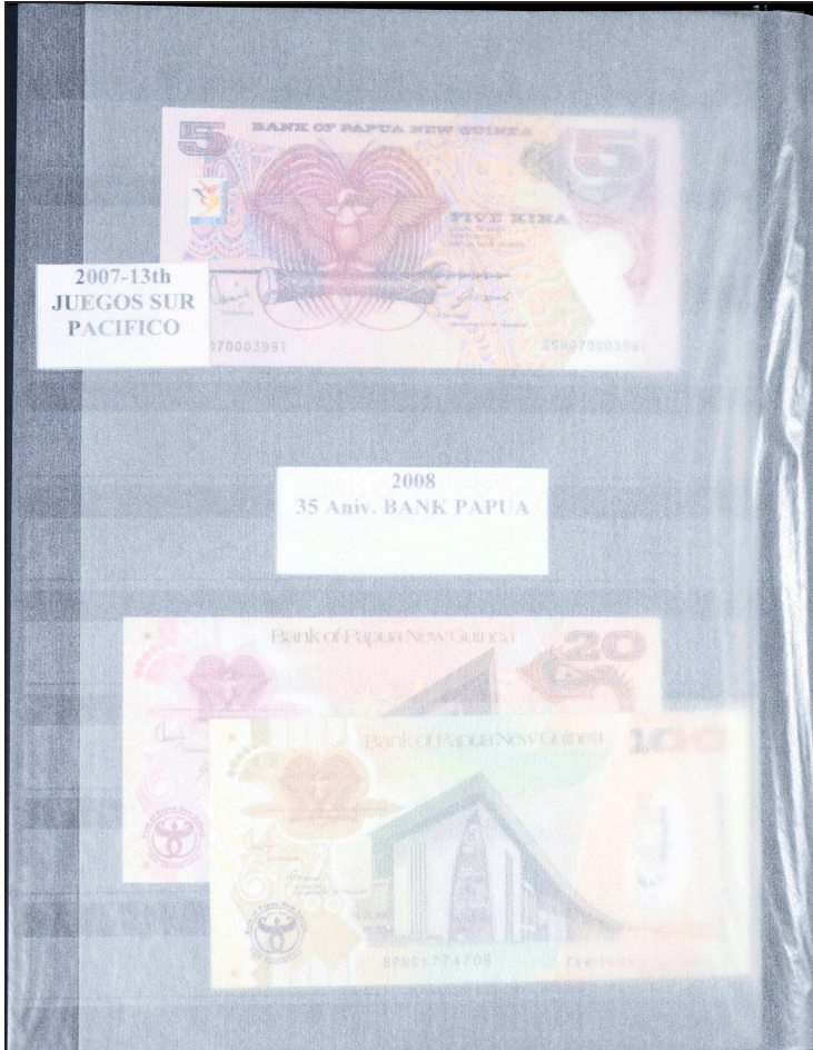
2007-13th JUEGOS SUR PACIFICO