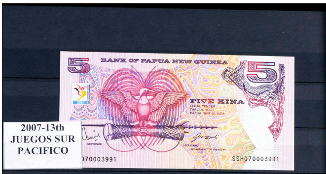
2007-13th JUEGOS SUR PACIFICO