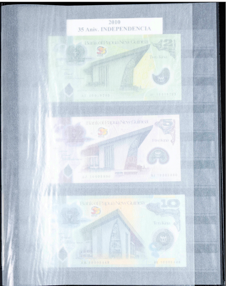
2010 35 Aniv. INDEPENDENCIA