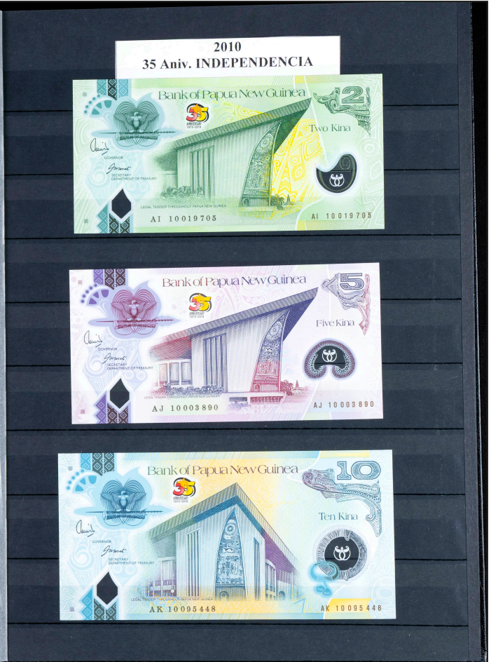
2010 35 Aniv. INDEPENDENCIA